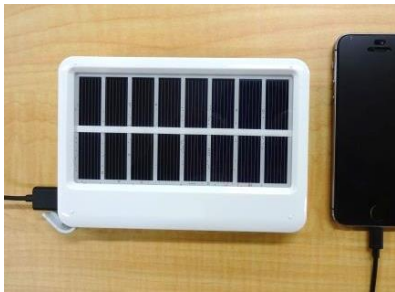
【1 W ~ 5 W】

(標準販売価格 5千円~5万円位) スマートフォンなどの通信機器充電や LEDライト点灯など