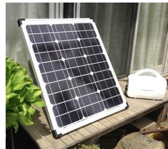
【30 W ~ 40 W】

(標準販売価格 5万円~8万円位) 左記に加えシガーソケット用炊飯器や 液晶TVなど (インバーター別売の場合有り)